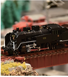
(株)マイクロエース C11-304 蕨保存車