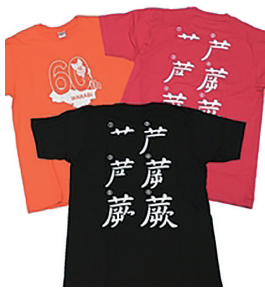
(有)染太郎 蕨書き順Tシャツ