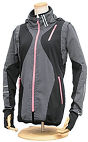
(株)ニイニ 双子織トラックジャケット