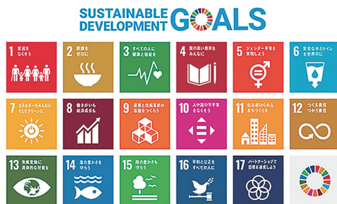
SDGs 17 のゴール

SDGs（エスディージーズ）とは、持続可能な開発目標（Sustainable Development Goals）のことです。2001年に策定されたミレニアム開発目標の後継として、2015年9月の国連サミットで加盟国の全会一致で採択された「持続可能な開発のための2030アジェンダ」に記載された、2030年までに