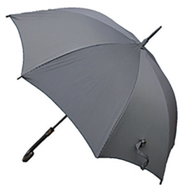
蕨双子織夢工房 双子織日傘