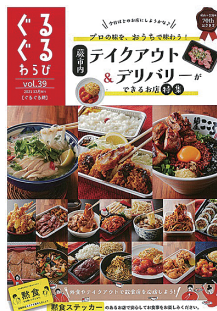
令和3年12月発行のぐるぐる蕨

不定期に発行している地域情報誌です。安価に広告を出すことができるとともに冊子は市報「広報わらび」に折込まれ、全戸配布されます。