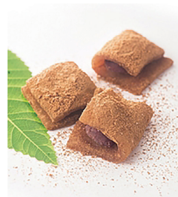
【参考】 第2期蕨ブランド認定品 「わらびの蕨もち」

第1回審査会の結果を受け、申請事業者は次回11月の最終審査会に向けて、各品のブラッシュアップを図っていきます。ブラッシュアップするにあたり、希望する事業者には当商工会議所が伴走型で支援を行います。11月の最終審査会を経て、第3回蕨ブランド認定品が決定し、広報用パンフレットやチラシ等が蕨市から発行されます。