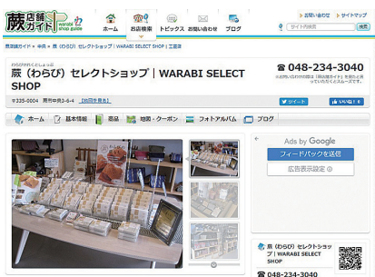
蕨店舗ガイドイメージ

当商工会議所が運営する地域情報サイトです。ホームページをもっていない事業所におすすめです。無料掲載もできますが、安価な有料オプションでセール情報等のタイムリーな店舗情報を発信できます。