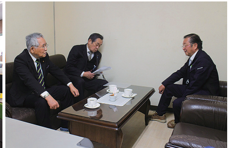
会社の歴史について説明を受ける