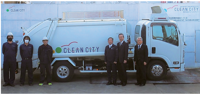
(中央右から) 小林社長、牛窪会頭、今井副会頭 ※社員の方にも撮影協力いただきました