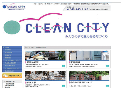
同社ホームページには多岐にわたる事業が写真つきでわかりやすく紹介されている