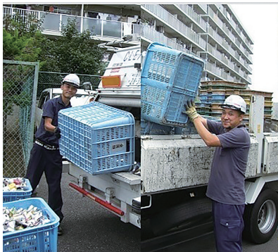
小林社長「蕨市出身の社員が多く、地域貢献の意識が高いです。」

魅力ある街、蕨。その縁の下の力持ちであるクリーンシティの底力をぜひ次世代へ引き継いでいただきたい。