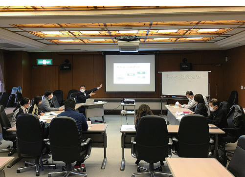
ゼミ形式のホームページ診断