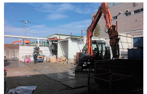
重機がある作業場では安全第一で業務が行われている