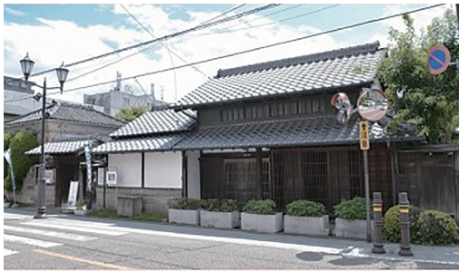
▲歴史民族資料館分館

・令和5年度 2社 ・令和6年度 3社 ・令和7年度 4社 サブリース事業による貸店舗化