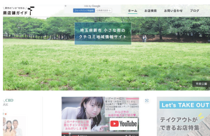
蔵店舗ガイドイメージ

当商工会議所が運営する地域情報サイトです。ホームページをもっていない事業所におすすめです。無料掲載もできますが、安価な有料オプションでセール情報等のタイムリーな店舗情報を発信できます。