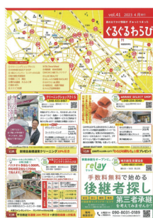
令和5年4月発行のぐるぐる蔵

不定期に発行している地域情報誌です。安価に広告を出すことができるとともに冊子は市報「広報わらび」に折込まれ、全戸配布されます。