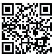
年収の壁に関する 厚生労働省HP

※本パッケージの詳細は、左記フリーダイヤルおよびQRコードから厚生労働省HPをご確認ください。 年収の壁突破・総合支援窓口 フリーダイヤル 0120-0301045 平日8時30分～18時15分