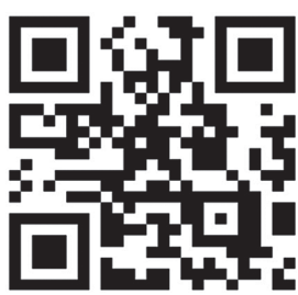
▲GビズIDについてはこちらからご確認ください

★各種補助金申請に当たり補助金申請はGビズIDを使用した電子申請が可能です。補助金申請前にGビズIDを取得することでスムーズな電子申請が可能となります。