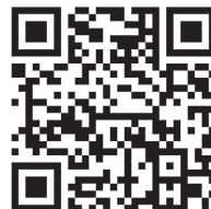
同店ホームページでは 独自のクーポンも発行されている

「きもの365」を会員登録し、税抜9,800円以上の注文をする際パスナンバー「50100466」を入力すると割引が適用されます！