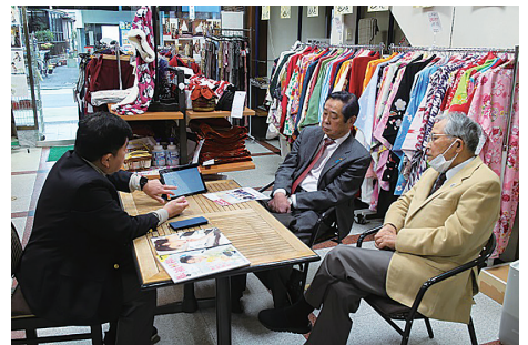
100年の歴史や会社概要について説明を受ける