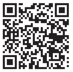
QRコードから特設サイトへアクセスできます