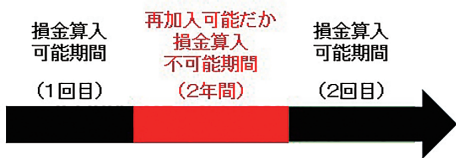
変更イメージ（参考）

（2）経営セーフティ共済（中小企業倒産防止共済）による節税目的の利用 本来の目的は、前述①の通り、取引先にもしものことがあった場合に加入事業所を救済することですが、